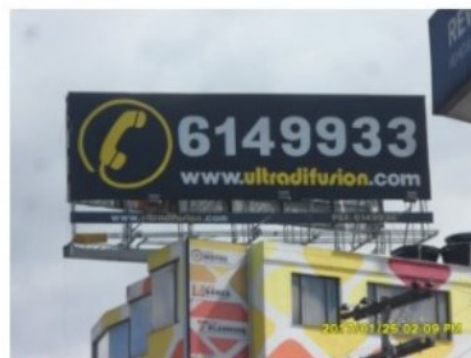
SENTIDO OESTE- ESTE DE LA VALLA TUBULAR