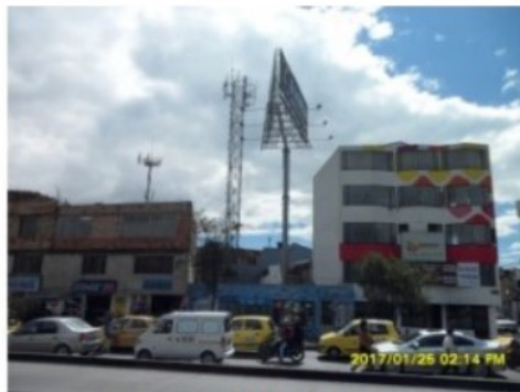
FACHADA DEL INMUEBLE Avenida Calle 145 No. 98B – 45