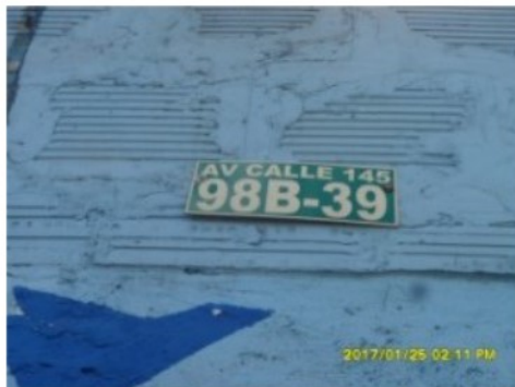
NOMENCLATURA DEL PREDIO